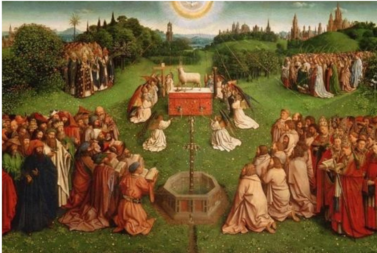
Jan van Eyck , geschilderd tussen 1430 en 1432 De aanbidding van het lam