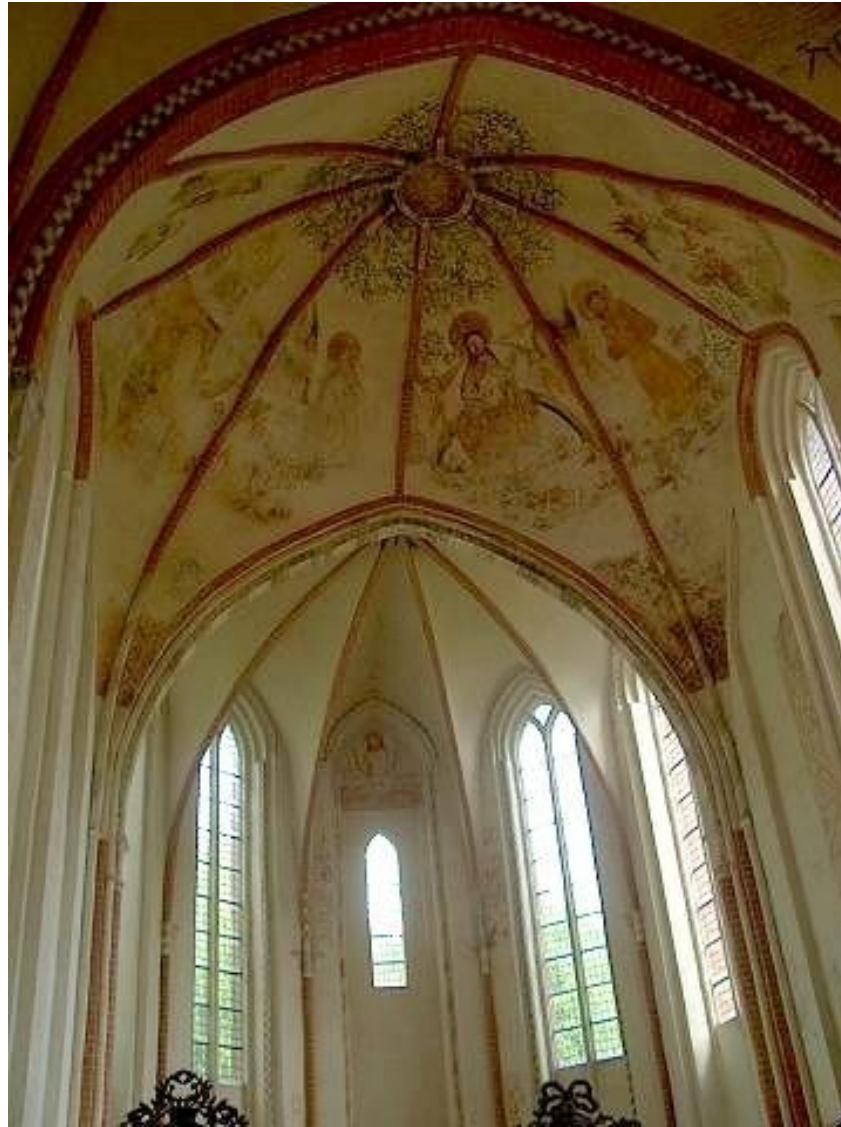
Laatste oordeel - kerk van Noordbroek, Groningen