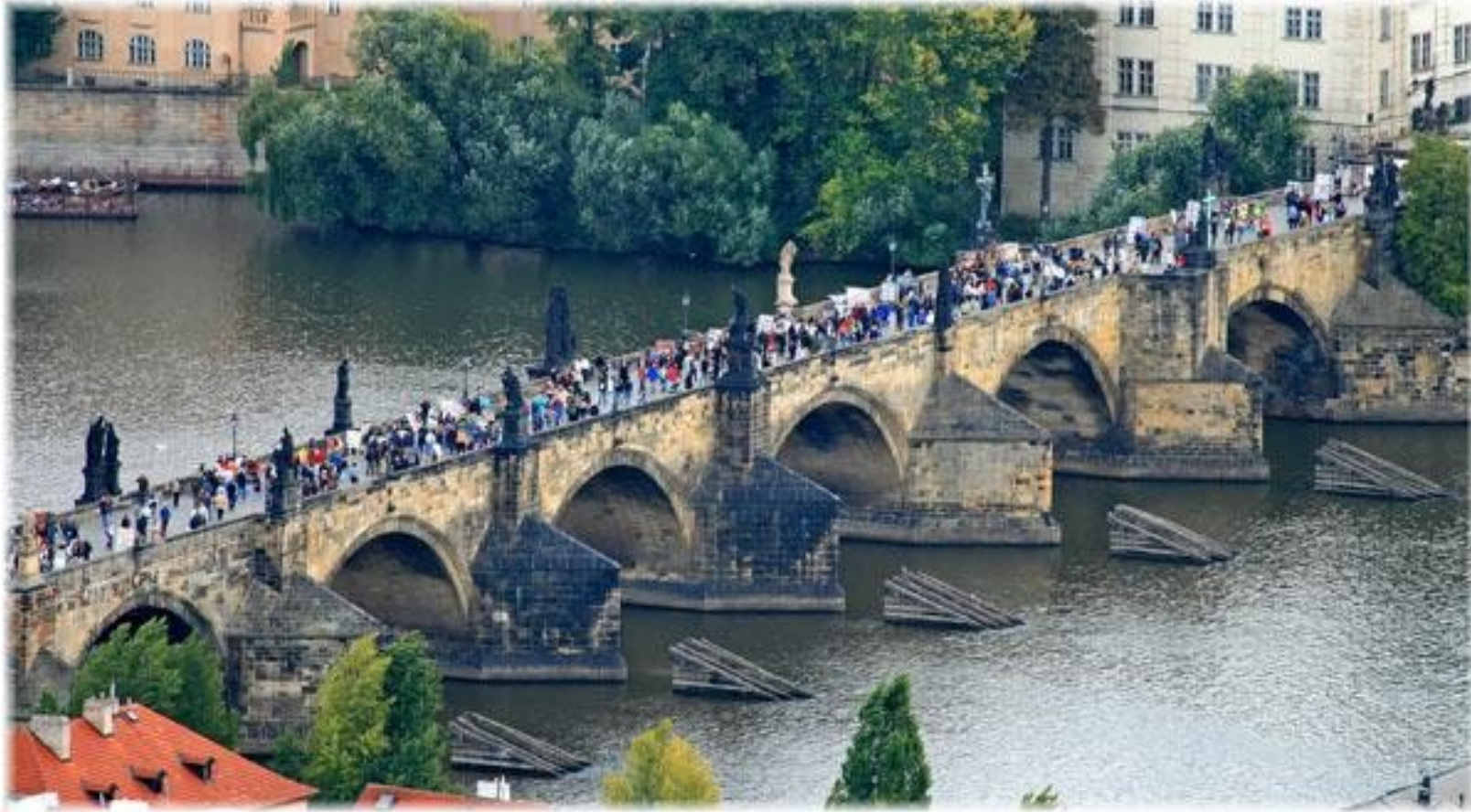
Praag, Karelsbrug met beelden

Crucifix, later, op kosten van Joden, voorzien van opschrift in het Hebreeuws (Jesaja 6:3)