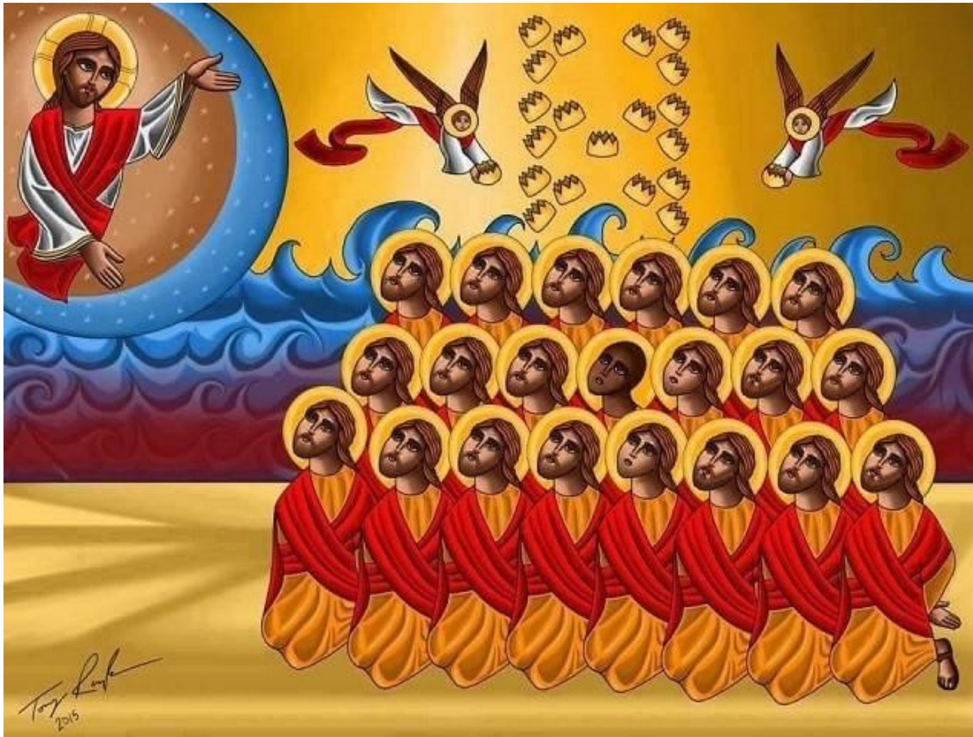
Martelaren, gepresenteerd binnen de liturgie als icoon