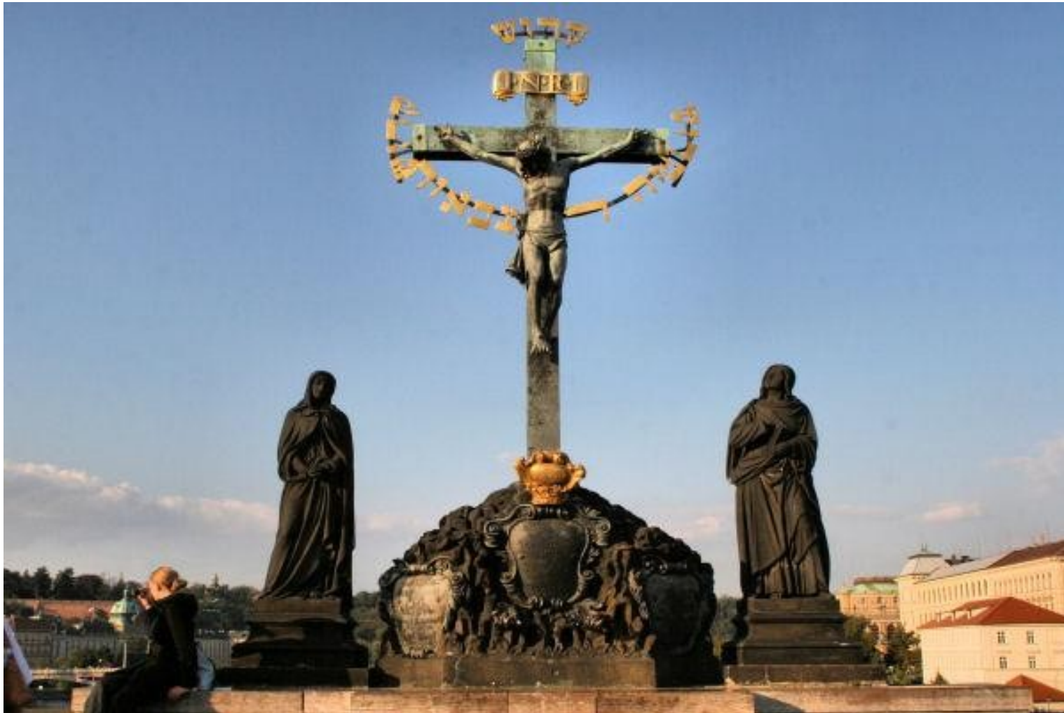
Praag, Crucifix op de Karelsbrug (1667) 17de-eeuwse Hebreeuwse inscriptie: 3X Heilig

Jesaja 6: 3 Zij riepen elkaar toe: 'Heilig, heilig, heilig is de HEER van de hemelse machten. Heel de aarde is vervuld van zijn majesteit.'