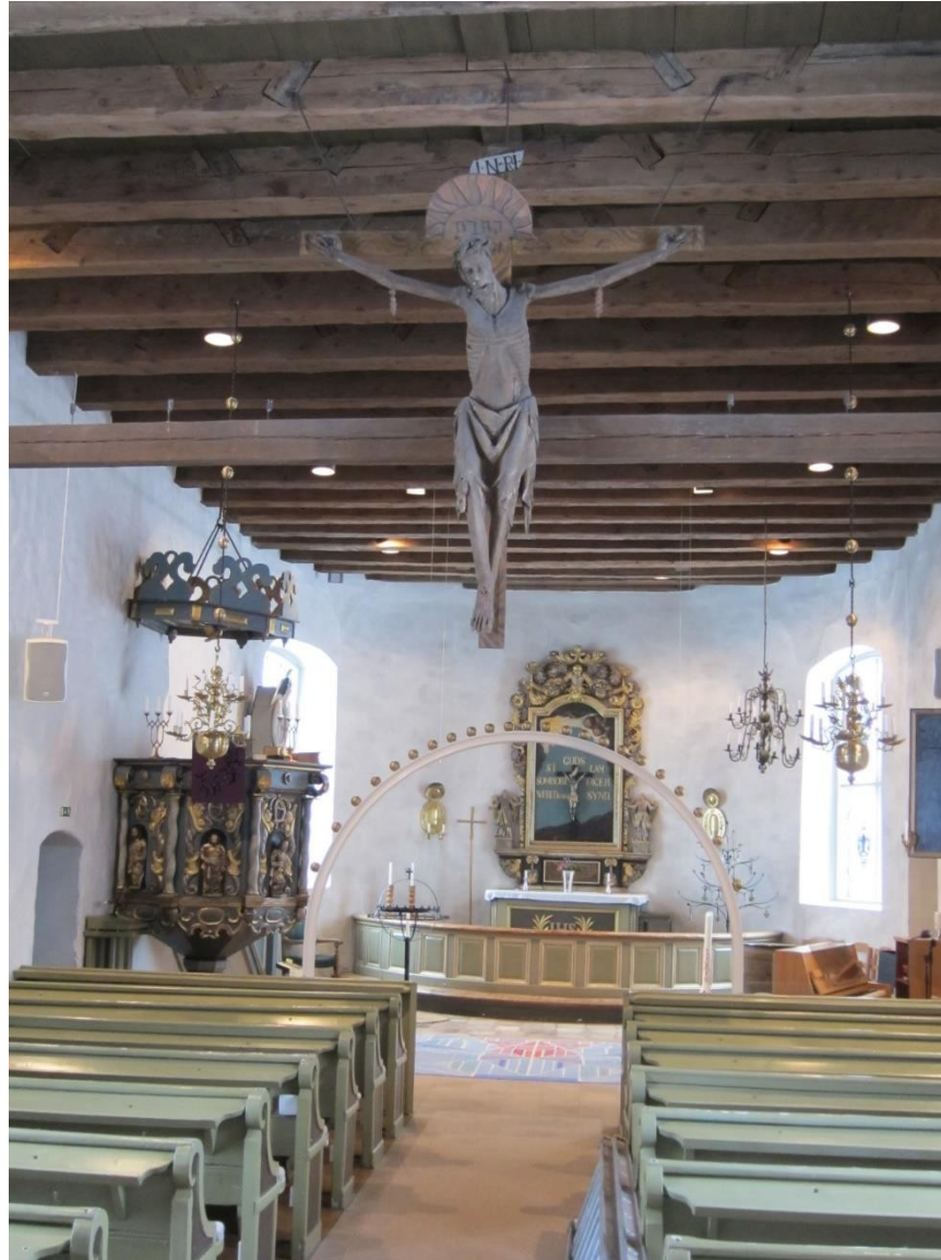
Crucifix in de kerk van Forserum, Zweden