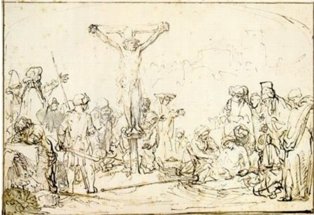
Rembrandt - kruisiging