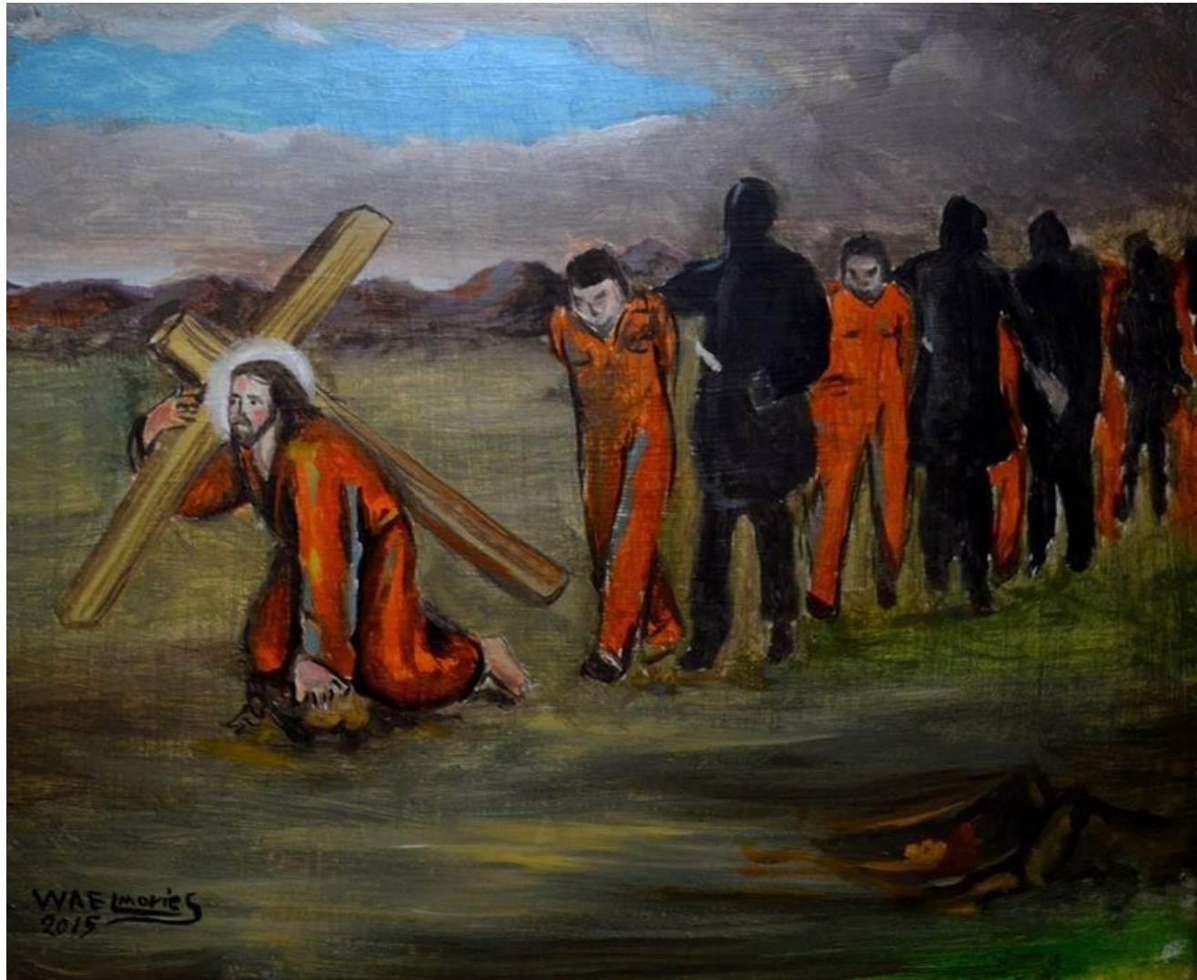
From Orange Jumpsuits to White Robes Martelaren, confronterend gepresenteerd als bijbelse en actuele realiteit