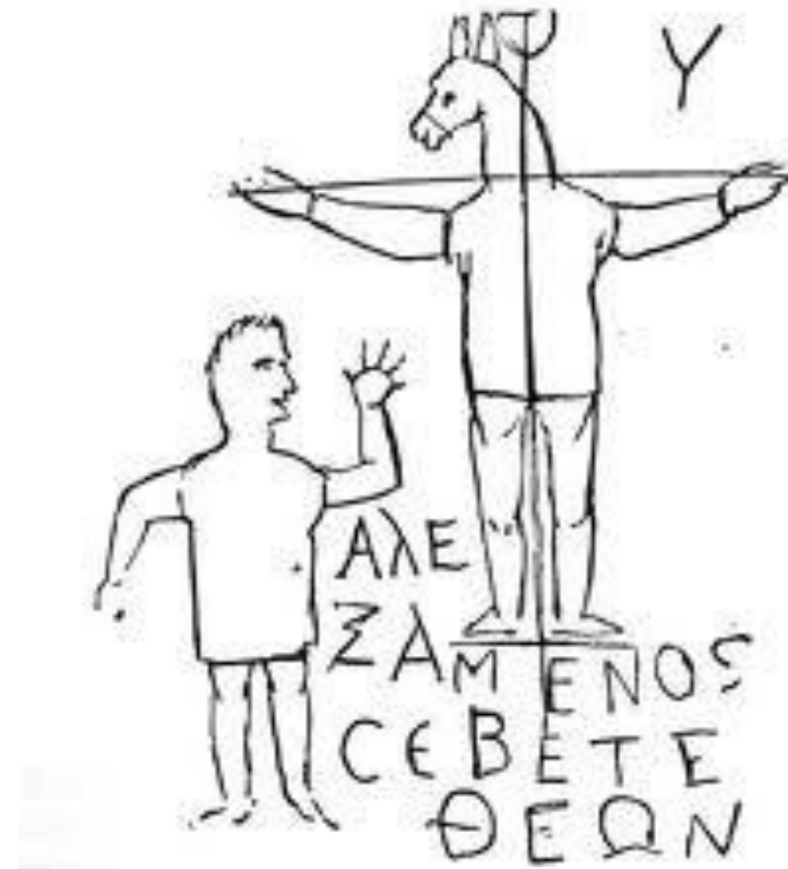
Romeinse cartoon (tekening) ‘Alexamenos aanbidt zijn God’ (Alexamenos sebeta theon) 1e, 2e of 3e eeuw n.Chr