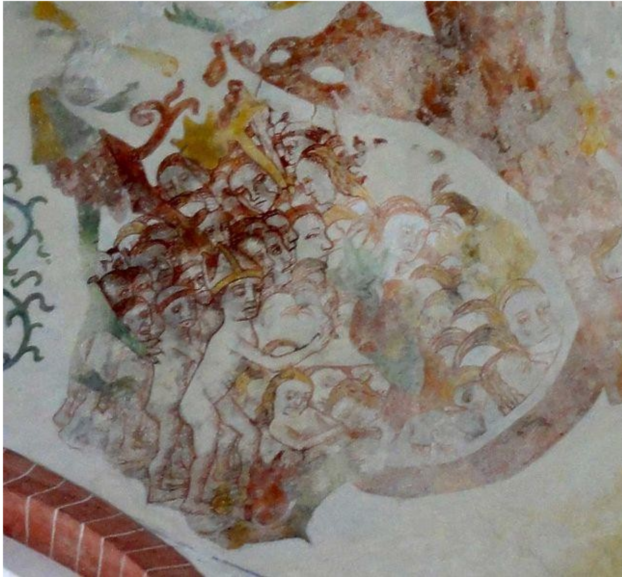
Laatste oordeel (de hel) - kerk van Noordbroek, Groningen. Cartoon van bisschop?